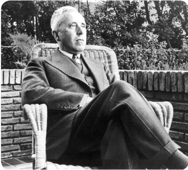
J. Huizinga.

ik van horen zeggen – vrij traditioneel les te hebben gegeven. Zijn betekenis voor exemplarisch onderwijs ligt daarom vooral bij de inhoudelijke aspecten van zijn denken over het spel en de schoonheid hiervan als gestalten van de werkelijkheid.