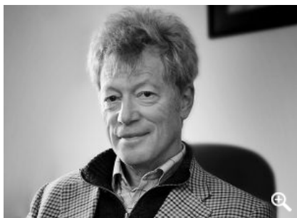
Roger Scruton.

Roger Scruton is een dwarse en erudiete denker die op een boerderij in Zuid-Engeland ecologische landbouw bedrijft, musiceert en op vossen jaagt. Beslissend in zijn leven was het jaar van de studentenrevolte in 1968. Als bij openbaring zag Scruton dat hier de grondslagen van de Europese beschaving werden weggeslagen in een waan van radicale