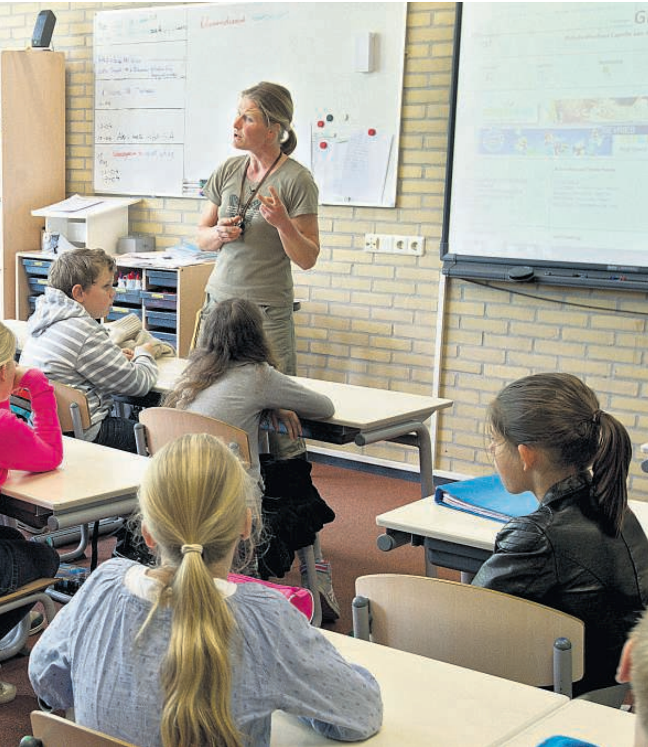
„De leraar heeft de taak om in zijn lespraktijk vensters te openen op de hemel.”

die besproken worden op een manier waarbij de leerkracht dicht bij de kinderen komt. Schitterend!